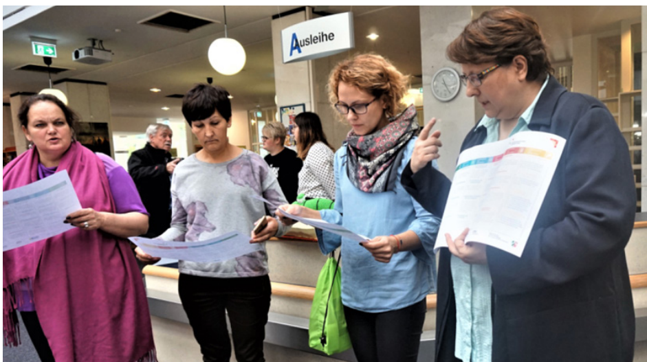
Stadtbücherei Ibbenbüren. https://www.stadtbuecherei-ibbenbueren.de/angebote/

Bibliotekos darbuotojai atlieka ne tik šviečiamąją veiklą, bet teikia pačias įvairiausias paslaugas bendruomenei – nuo knygų išdavimo, parodų ir gimtadienių organizavimo iki paveikslų ant audinio atspausdinimo, nes turi 3D spausdintuvą. Apie bibliotekos veiklas lankytojai gali sužinoti iš karto atėję į biblioteką, kur dideliame